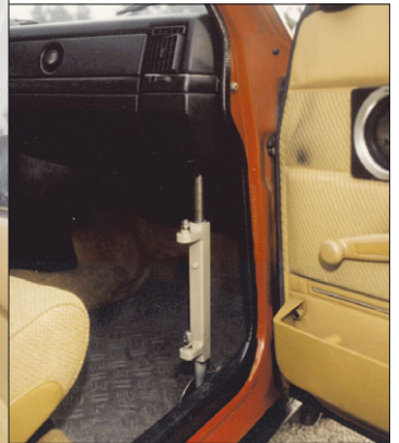
Den fastmonterede liftkonsol er det eneste synlige i bilen, når liften er taget af.